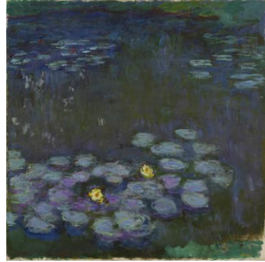
クロード・モネ《睡蓮》 1914-17年 200×200cm 当館蔵