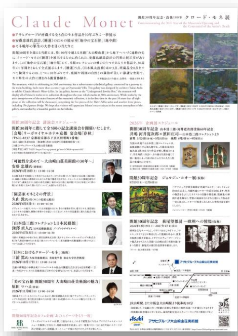
A4チラシ表裏ビジュアル