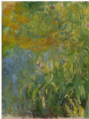
クロード・モネ《アイリス》 1914-17年 200×150cm 当館蔵