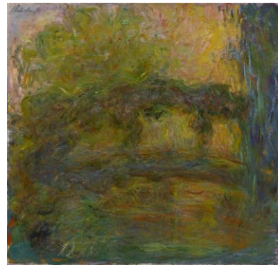
クロード・モネ《日本風太鼓橋》 1918-24年 89×93cm 当館蔵