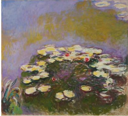
クロード・モネ《睡蓮》 1914-17年 180×200cm 当館蔵